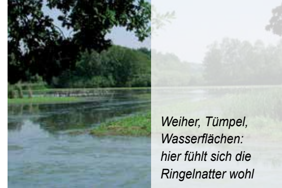
Weiher, Tümpel, Wasserflächen: hier fühlt sich die Ringelnatter wohl