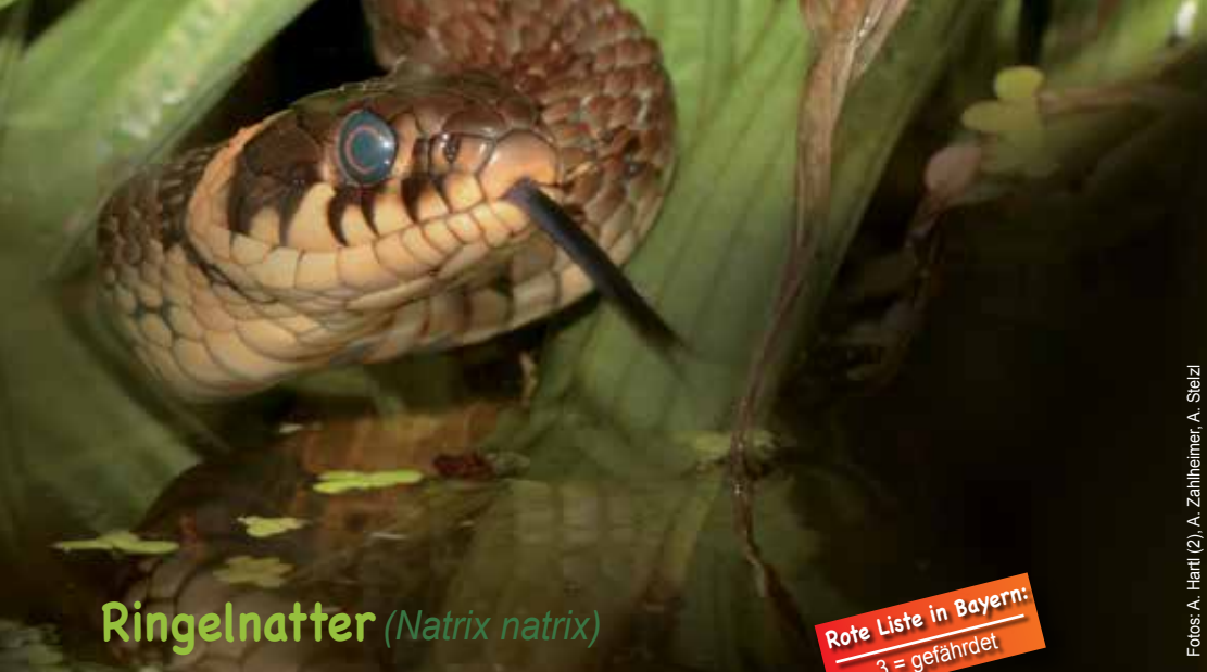
Ringelnatter ( Natrix natrix )