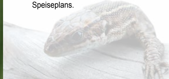
Waldeidechse beim Sonnenbad

Im Gegensatz zur Zauneidechse, die Eier legt, ist die Waldeidechse lebendgebärend. Sie besitzt das größte Verbreitungsgebiet aller Reptilien auf unserem Planeten. Von Spanien bis nach Sachalin und von der Barentssee bis in die Poebenen Italiens kommt sie überall vor. Fast ganz Eurasien wird von ihr bewohnt. Ihre Ost-West-Ausbreitung beträgt über 11.000 km und ihre Nord-Süd-Ausdehnung immerhin noch über 3.100 km. Sie ist damit das erfolgreichste Reptil auf unserem Planeten und übertrifft dabei noch die Kreuzotter.