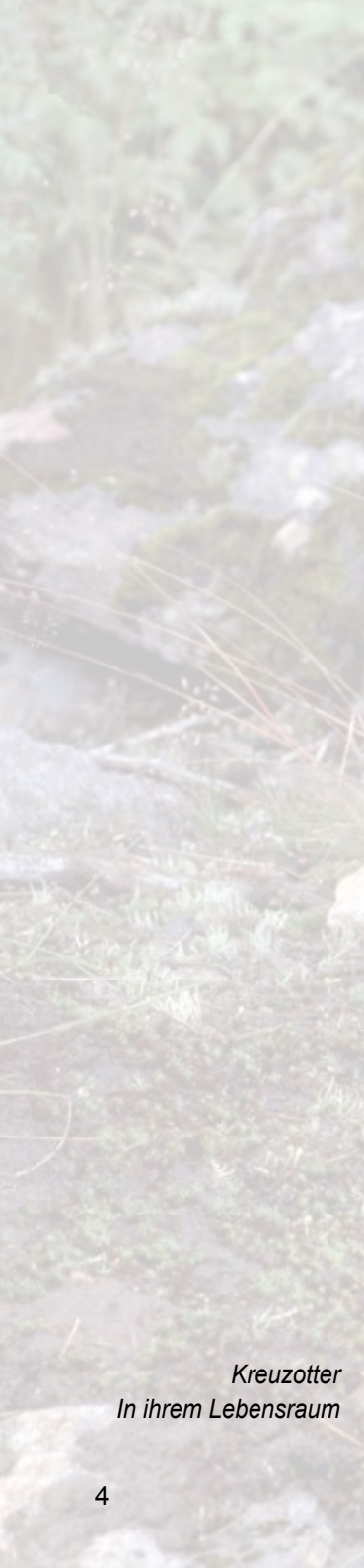
Kreuzotter In ihrem Lebensraum