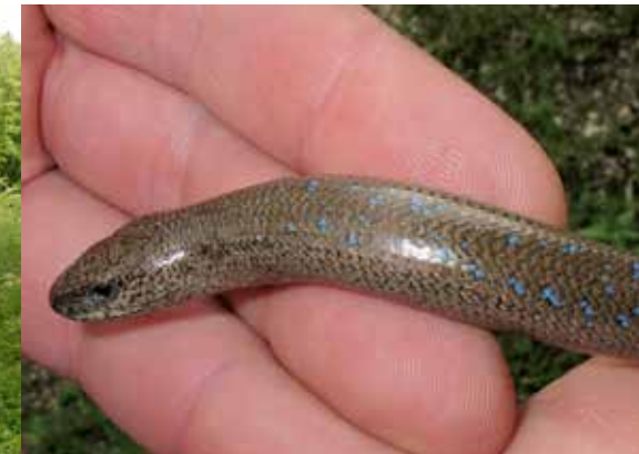
Männliches Tier mit blauer Zeichnung