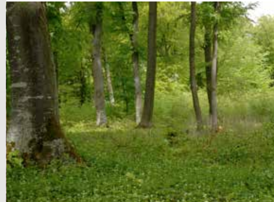
An eher feuchten Waldrändern fühlen sich Blindschleichen wohl

Trotz ihres langgestreckten Körpers ohne sichtbare Beine gehört die Blindschleiche nicht zu den Schlangen. Sie ist eine „fußlose Echse“, die sich in der Art der Beschuppung und in ihrer eigenen Form der schlängelnden Fortbewegung deutlich von Schlangen unterscheidet. Schleichen bilden in der Systematik eine eigene Familie. Achtung, auch Blindschleichen können wie die beiden Eidechsenarten ihren Schwanz bei Gefahr abwerfen. „Fragilis“ die Artbezeichnung (im lateinischen Namen = zerbrechlich), weist auf diese Eigenschaft hin. Allerdings wächst er nicht mehr nach, sondern bildet nur noch ein stumpfes Ende aus.