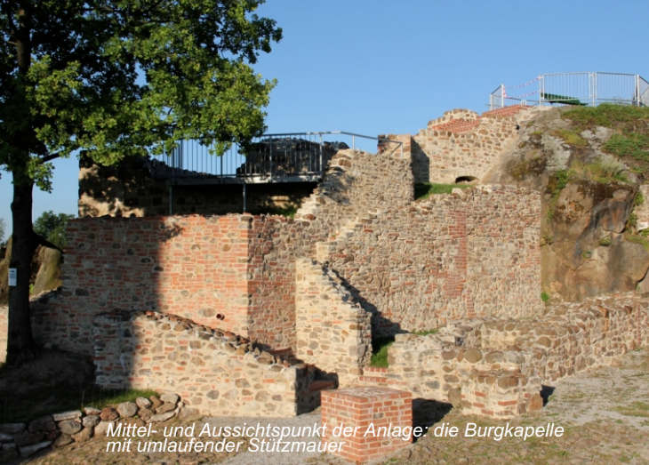
Mittel- und Aussichtspunkt der Anlage: die Burgkapelle mit umlaufender Stützmauer