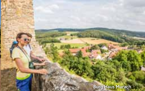
Burg Haus Murach