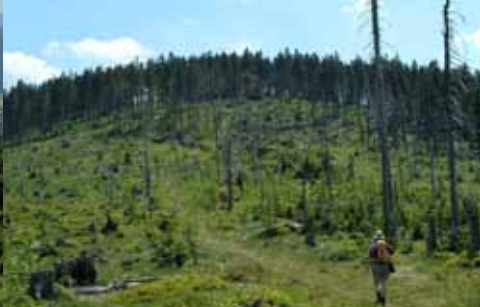
Nationalpark Bayerischer Wald