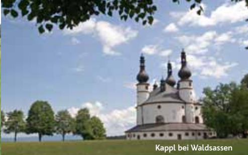
Kapll bei Waldsassen