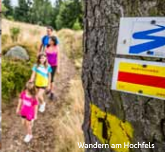
Wandern am Hochfels