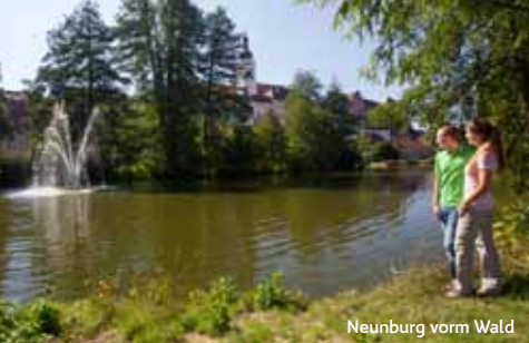
Neunburg vorm Wald