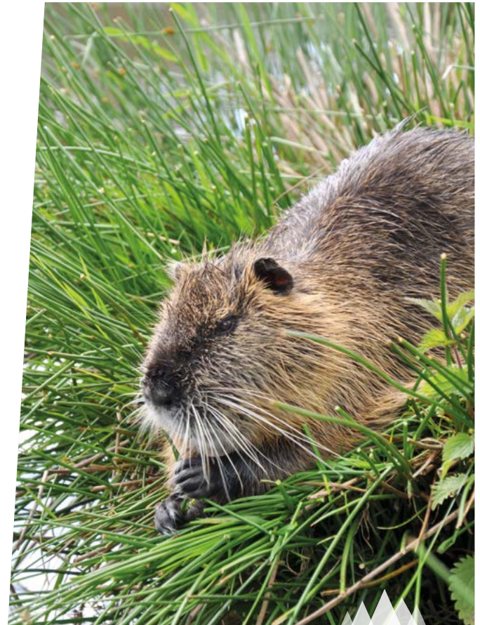
Auf den Spuren des Bibers

ONLINE BUCHEN www.bayerischer-wald.org/erlebnisse