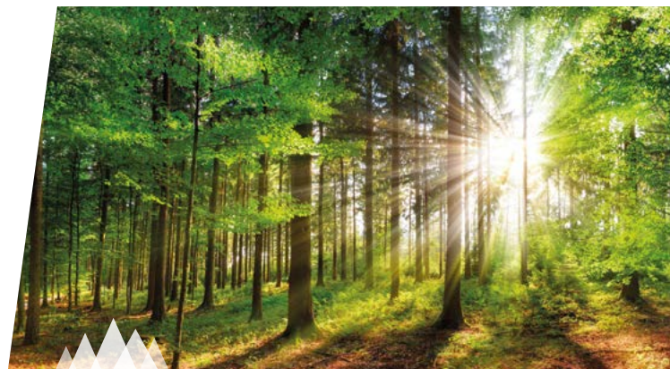
Wanderung im Frühlingswald

ONLINE BUCHEN www.bayerischer-wald.org/erlebnisse