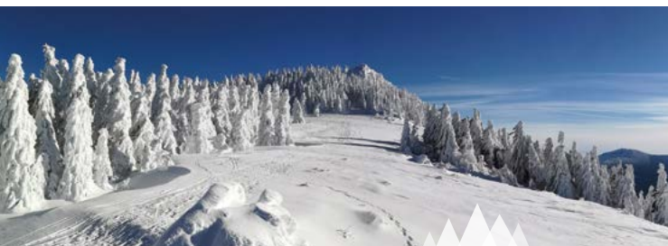
Kleiner Ossergipfel im Winter

ONLINE BUCHEN www.bayerischer-wald.org/erlebnisse