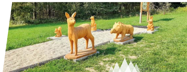
Holzweg in Lambach