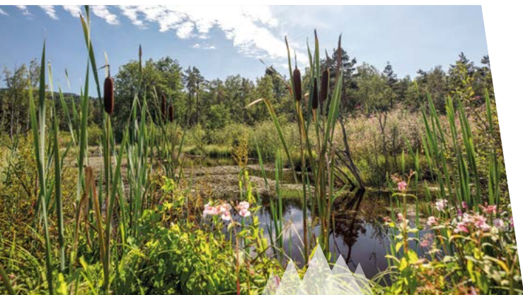
Im Arracher Moor

Entlang eines Bohnensteges kann man das Naturschutzgebiet und FFH-Gebiet Arracher Moor und seine Besonderheiten kennen lernen. Dreisprachige Infotafeln informieren in einem Holzpavillon über die Entstehung und die Tier- und Pflanzenwelt des Moores.