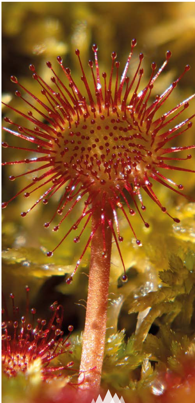
Rundblättriger Sonnentau am Kleinen Arbersee