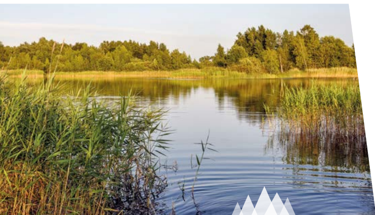
Wasser, Schilf und Nasswiesen