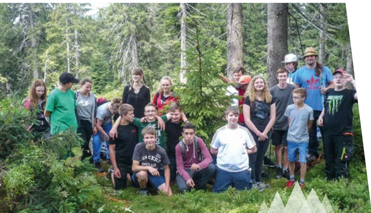
Wandertag mal anders! Spielerisch die Natur erkunden.